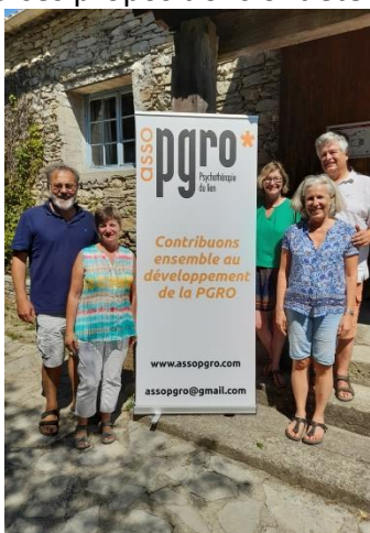
Le nouveau CA

L'accent a été mis sur l'importance de nous retrouver en présence, et diverses propositions ont été débattues : la création d'un forum, l'accès